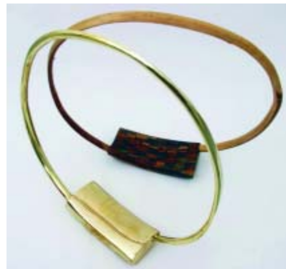
Maxim Dumitraș Absența încercuită (2008)

Ce expune Maxim Dumitraș? Structuri circulare suspendate la înălțime, „absențe” încercuite, „goluri” circumscrie prin contur desenat. Intenția artistului este aceea de a capta spațiul în orizon-