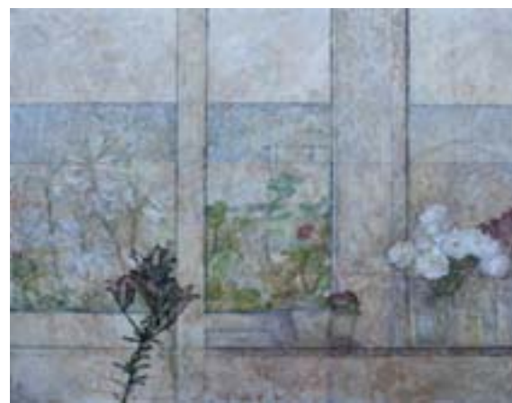
Horea Paștina Fereastra (2011)

„cu lama de ras să șteargem bronzul duminicilor/ care stă ca o cămașă de forță peste bucuriile simple/ ca un strat de ciment peste fericirea așază mică cum e/ și strînsă în clopotul cu care sunăm dimineața” ( Cu lama de ras ștergem bronzul duminicilor ).