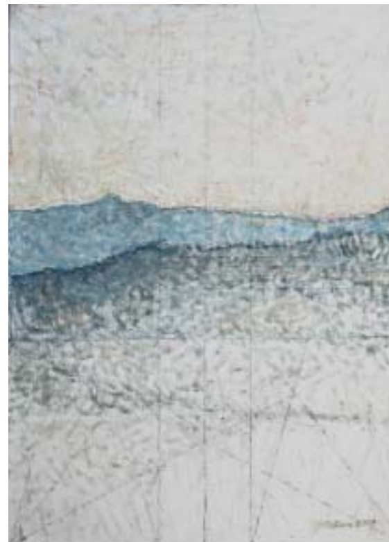
Horea Paștina Peisaj la Panaci (2009), ulei pe pânză

Cetatea Gherlei ascunde și azi multe mistere. Aici, după ce cetatea a devenit închisoare (1785) și până azi, nu s-au putut face cercetări