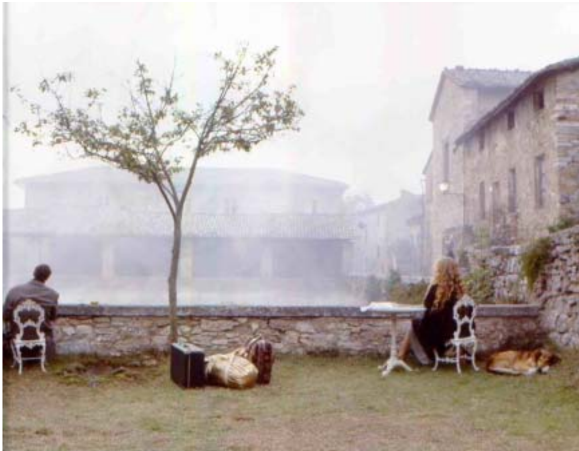
Cadru din Nostalgia (1983)

5 „Din păcate, nu mă pot ruga într-o biserică catolică. Nu că nu pot, nu doresc. Este un loc care mi-e străin.” (Andrei Tarkovski)