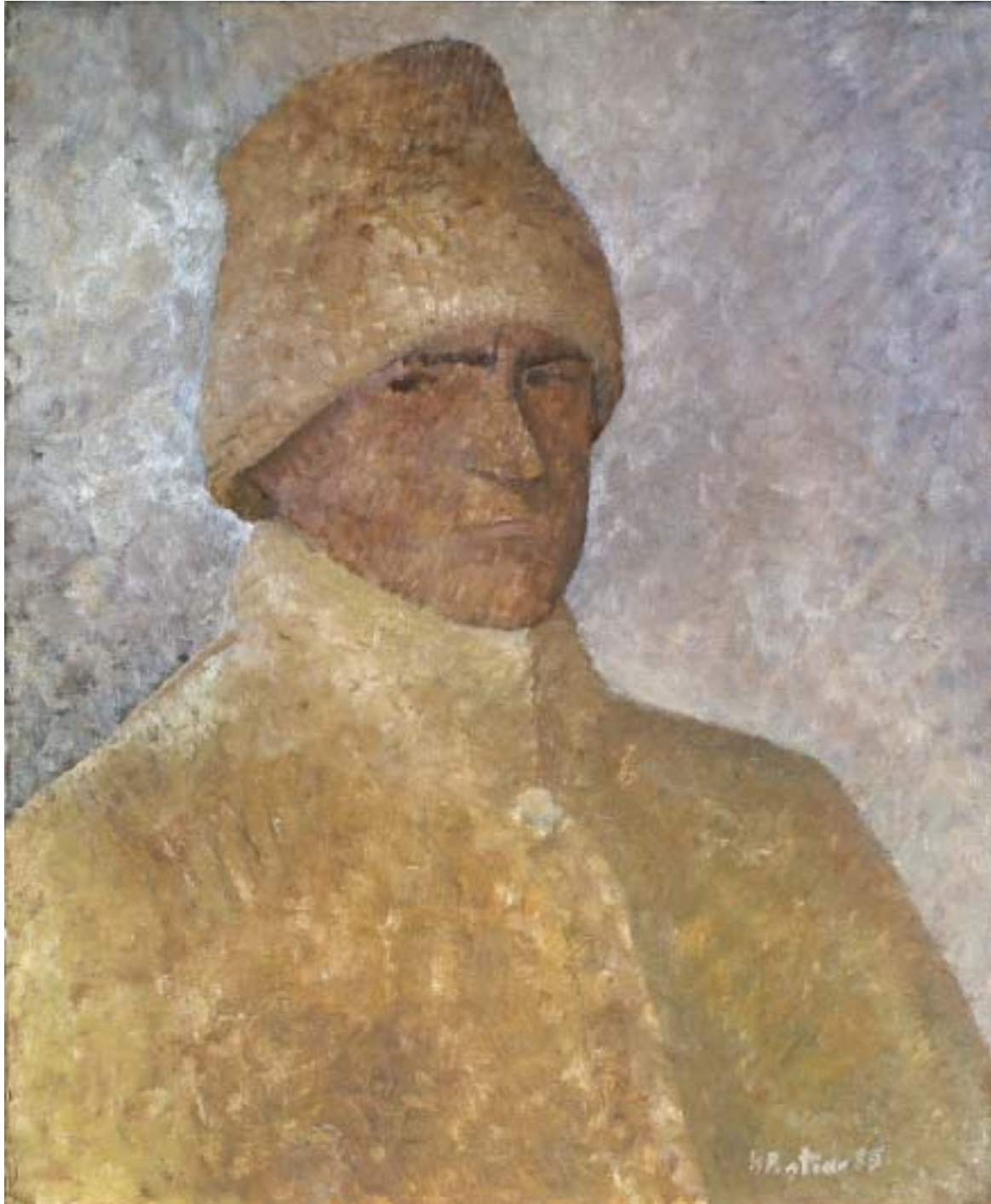
Horea Pa o tina