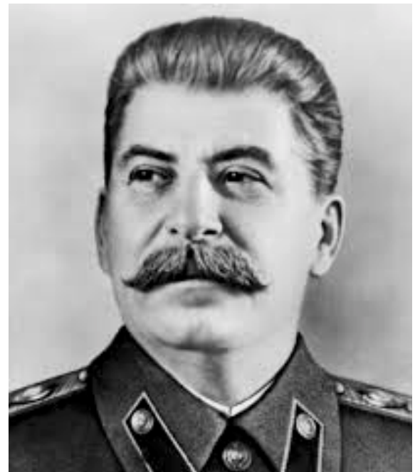
Iosif Vissarionovici Stalin

În cartea lui Montefiore, tiranul apare atât ca un fiu, soț și tată denaturat, indiferent față de părinții săi, mai ales față de mamă, și față de soția și copiii săi. Muncind până la epuizare pentru a-și duce până la capăt planurile diabolice, el s-a dedicat aproape exclusiv obsesiei sale pentru putere, încon-