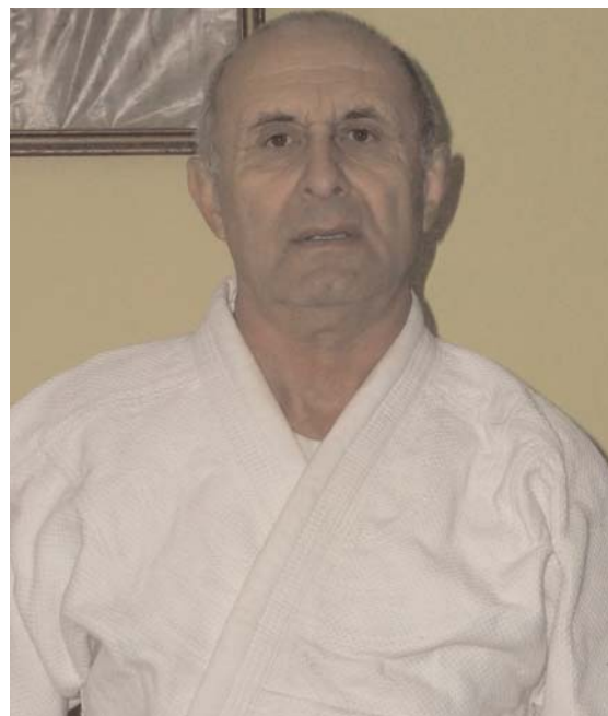
gestionarea insuccesului, situații foarte frecvente pentru un sportiv. Cum reușiți să le țineți în frâu?

– Am observat că sunt importante stăpânirea momentului de euforie pricinuită de victorie și