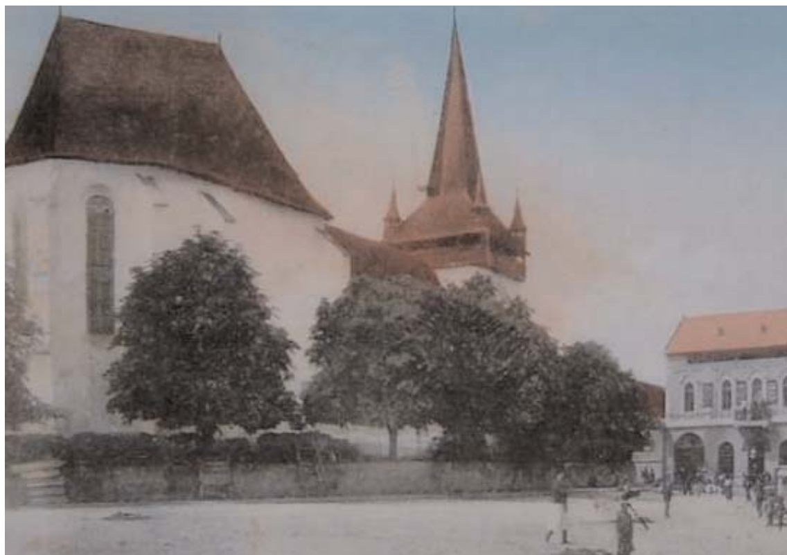
Centrul Huedinului interbelic

O analiză atentă a perioadei 1961-2011 ar arăta fără echivoc că Huedinul, chiar dacă are doar 10.000 de locuitori, are toate aspectele necesare unui oraș, fiind un centru al zonei.