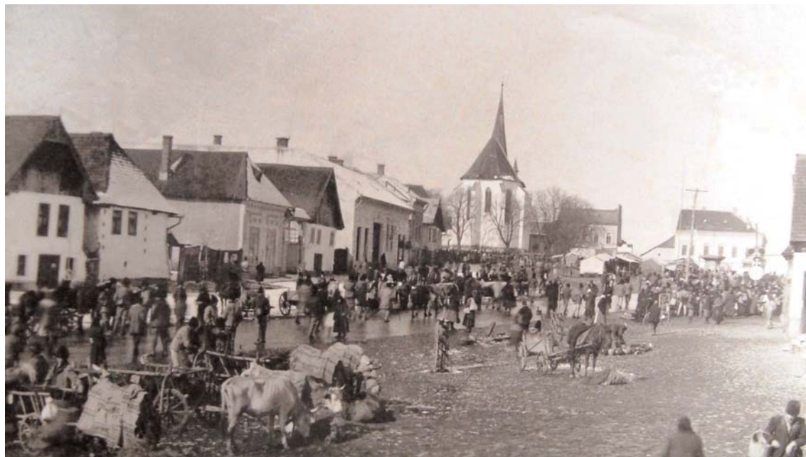
Târg în Huedinul interbelic