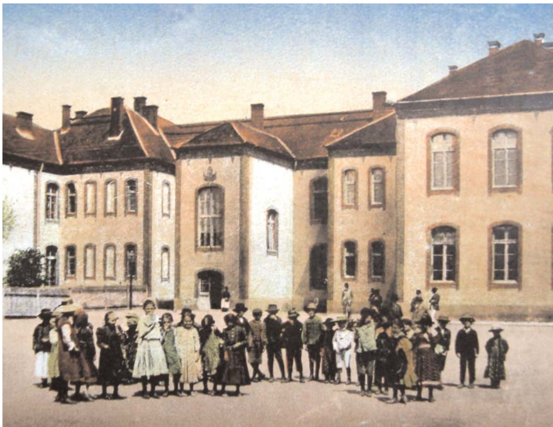
Școala din Huedinul interbelic