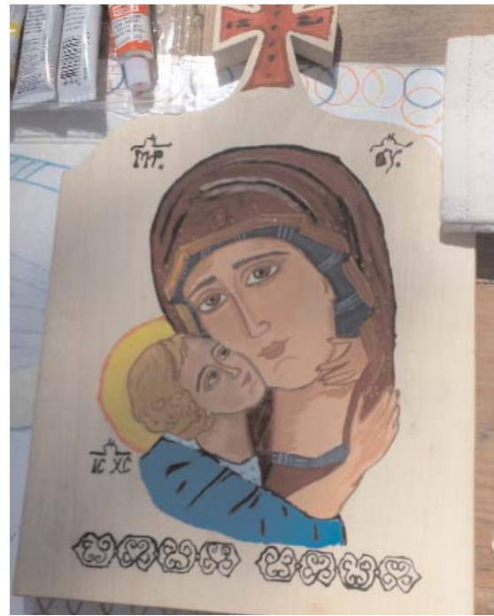
Icoană pictată pe lemn

Am primit cartea ta „Lebăda neagră” ix . E o carte mare, pe alocuri, acolo unde poetul stă de vorbă de la egal cu Dumnezeu și cercetează timpul, veșnicia, moartea și viața, aș zice că ești chiar genial. Sihăstria ta în Munții Apusului cei curați care n-au cunoscut blestemul aurului, te-a făcut să vezi, să judeci și să înțelegi mai profund, mai limpede, mai exact viața și apendicele ei - omul. Sunt poezii memorabile. De fapt, acesta e Testamentul tău poetic, uman. Mărturisirea credinței, îndoielilor și întrebărilor tale. Un fel de antologie, DAR cele nedatate, scrise mai nou, îmi par și sunt cuceritoare și chiar cutremurătoare.