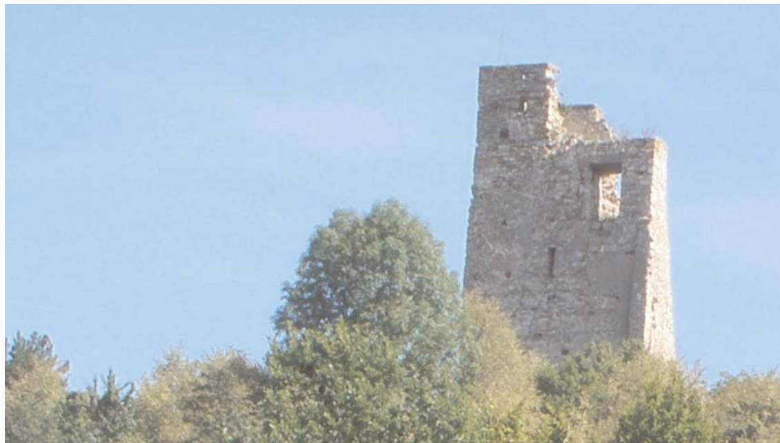
Donjonul Cetății Almașului