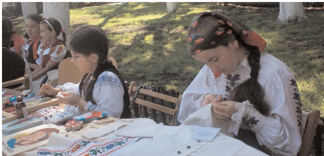
Costum tradițional din pânză de cânepă lucrată manual

Concurenții au fost îmbrăcați în costume populare specifice zonei folclorice de proveniență, unele fiind chiar foarte vechi. În încheiere, vreau să felicit organizatorii pentru corectitudinea de care au dat dovadă, atât în ceea ce privește organizarea, cât și premiarea participanților.