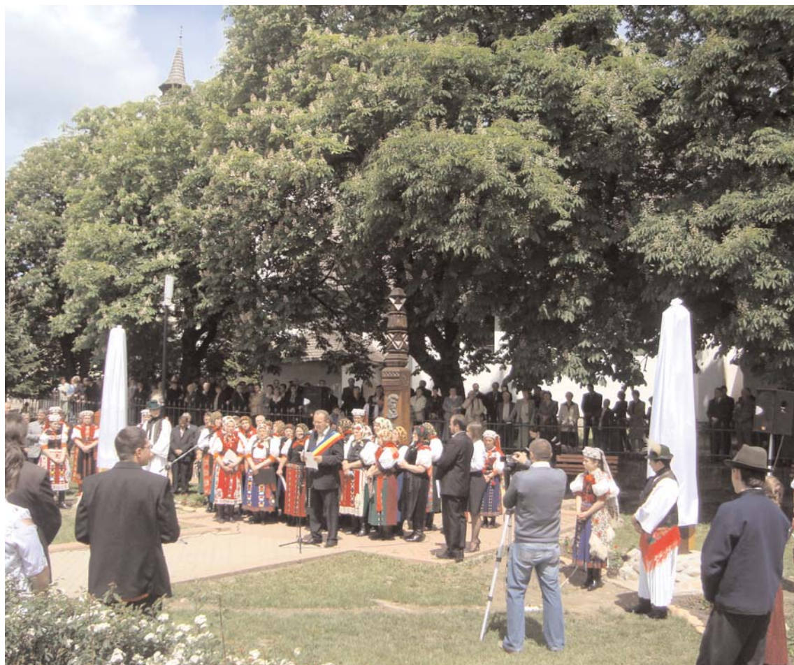
Dezvelirea efigiilor (Huedin, 23 mai 2010)

Editarea de cărți, monografii, anuare, reviste, suplimente («Liceul Teoretic „Octavian Goga” Huedin. Un liceu cu tradiție, în slujba comunității», „Cei rămași pe pământ”, „Anuarul Grupului școlar Huedin pe anul 2009-2010”, „Negreni. Istorie, tradiții și legende. Studiu monografic”, „30 de ani de judo la Huedin 1980-2010”, „Glasul”, „Kalotaszeg”, „Claviaturi”), inaugurarea celor patru efigii în memoria unor personalități huedinene, precum și sfințirea bisericii de lemn din incinta spitalului orașenesc Huedin, contribuie la efervescența culturală a unei comunități.