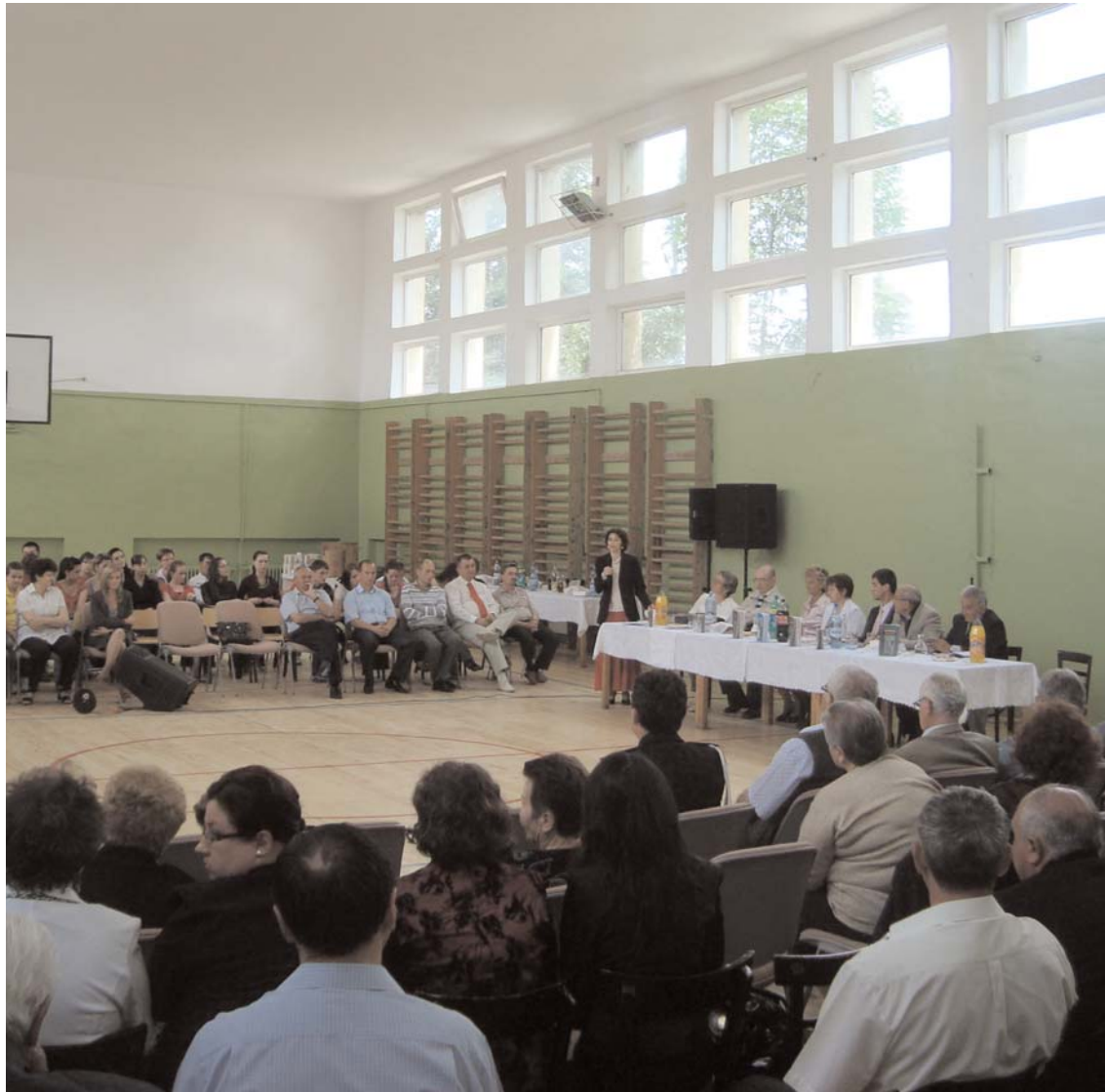
Zilele Liceului Teoretic „Octavian Goga” Huedin (26-28 mai 2010)

28.V.-3.VI.2010 - Deplasarea în Franța a