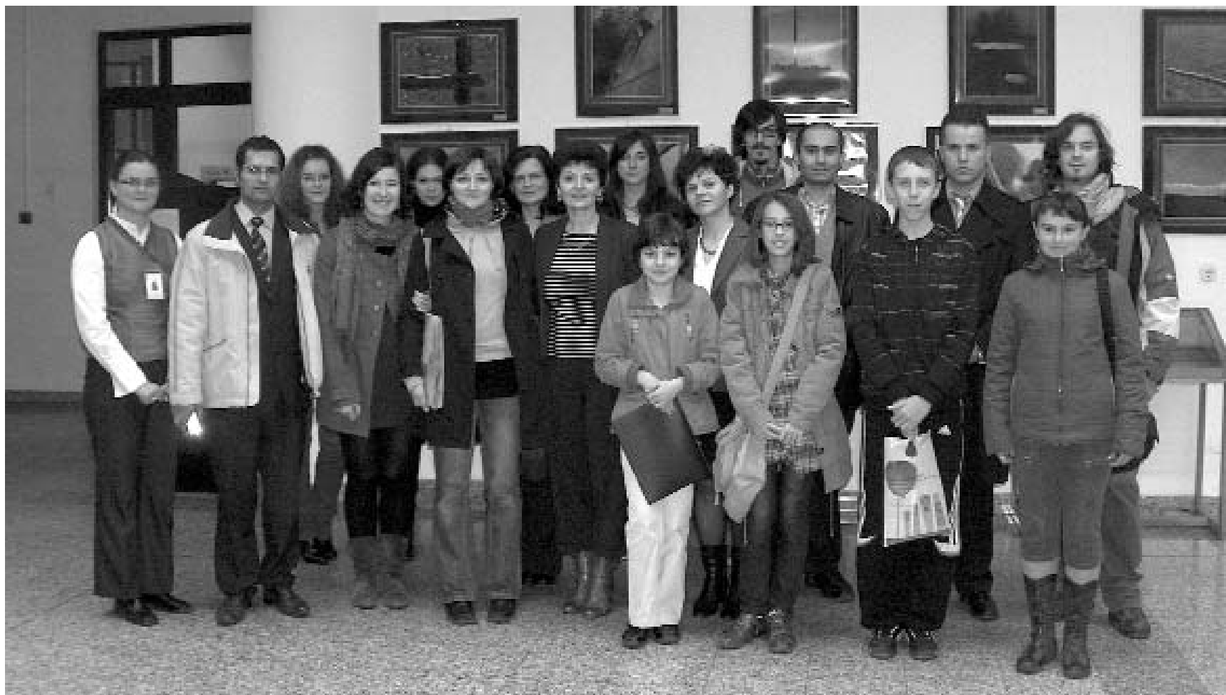
Participanții la Seara poloneză împreună cu delegația din Cracovia

Colaborarea cu partenerii polonezi se va concretiza în noi proiecte de promovare a literaturii și culturii atât poloneze, cât și române. ■