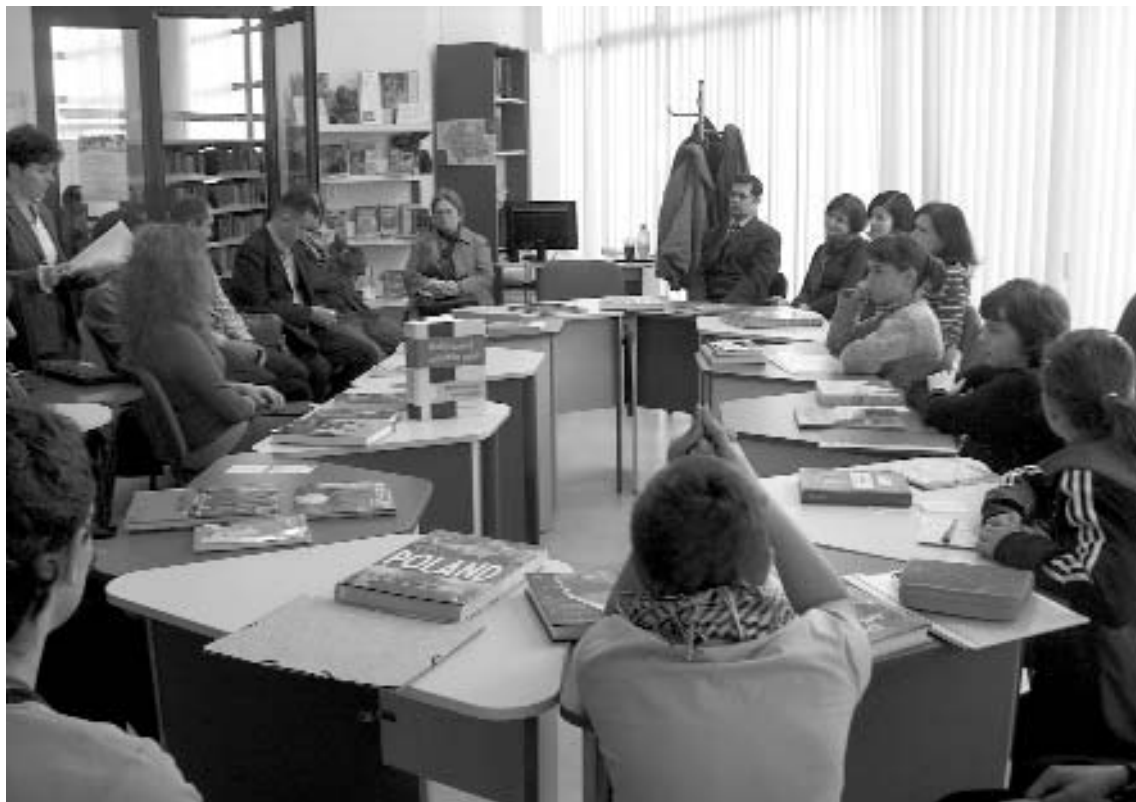
Aspecte de la Seara de literatură poloneză

Pentru că omul mare nu poate să își pieptene mîntea, să își facă cărare pe mijloc, având în partea dreaptă o codiță împletită în care a