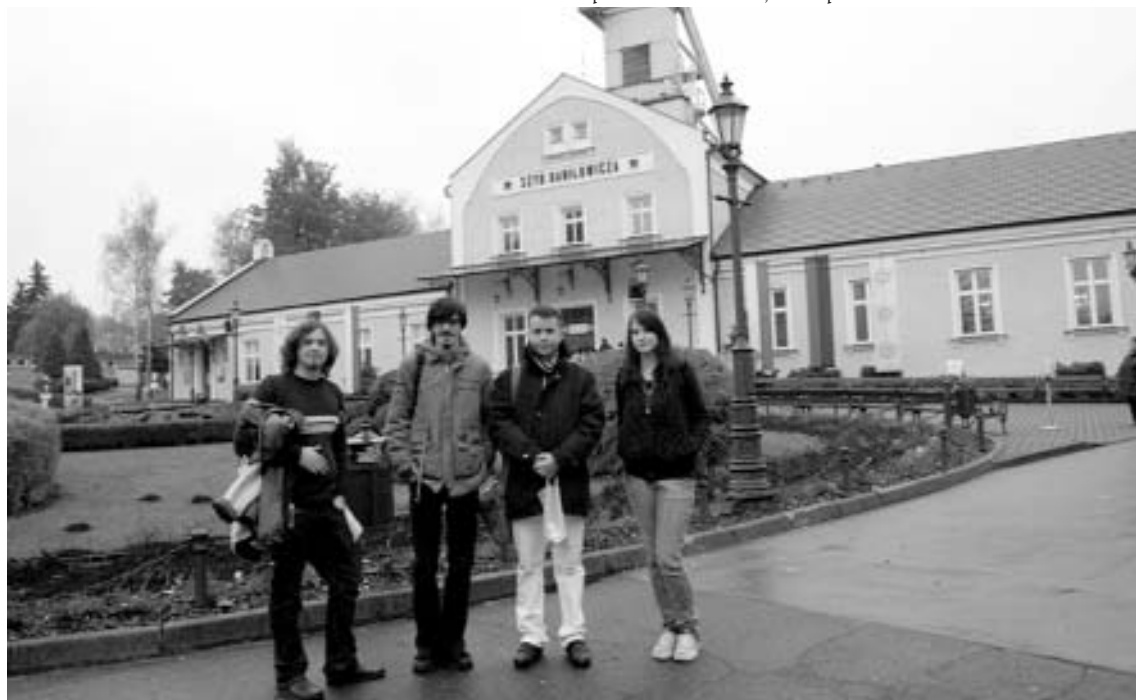
Premianții concursului de eseuri, pe străzile Cracoviei

Eugeniusz Get-Stankiewicz, nu doar că demontează spusele lui A. M. Cassandre, ba mai mult, tratează afișul cu aceeași intimitate cu care tratezi un jurnal și arată că până și un domeniu care în alte țări și sub mâna altor creatori a luat deja drumul tehnologiei săracă emoțional, poate fi încărcat de spiritualitate.